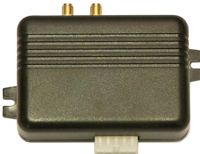
Рис. 1. Общий вид терминала.

Передача данных возможна только при наличии сети сотовой связи стандарта GSM 900/1800 поддерживающей услугу пакетной передачи данных (GPRS).